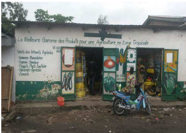
Magasin de vente de produits phytosanitaire