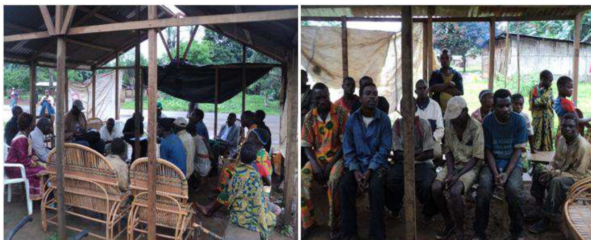
Les peuples autochtones de Moukanda en entretien sur les pestes et pesticides

L'entretien avec les populations autochtones de Moukanda sur les pestes et pesticides a eu lieu à la date du 27 Novembre 2014 au campement éponyme des peuples autochtones et elle a réuni les représentants des peuples autochtones et des autochtones libres et intéressés par la rencontre. Sur les pesticides les peuples autochtones avancent qu'ils en ignorent complètement leur utilisation. Ci-dessous le compte rendu de l'entretien :