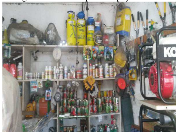
Pépiniériste à Brazzaville