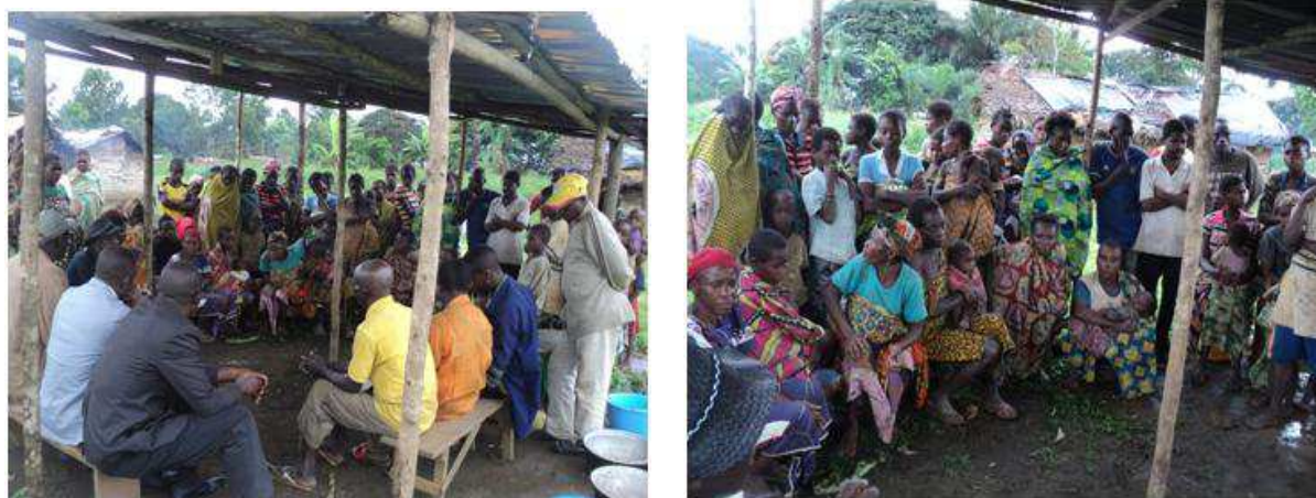
Les populations autochtones d'Indo en entretien sur les pestes et pesticides

Les autochtones d'Indo, tout comme ceux de Moukanda, affirment qu'ils ignorent les pesticides et là-dessus, ils resteront sans suggestion ni recommandations. Ci-dessous le compte rendu de la consultation :