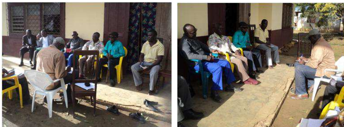
Les communautés locales de Sibiti en entretien sur les pestes et pesticides