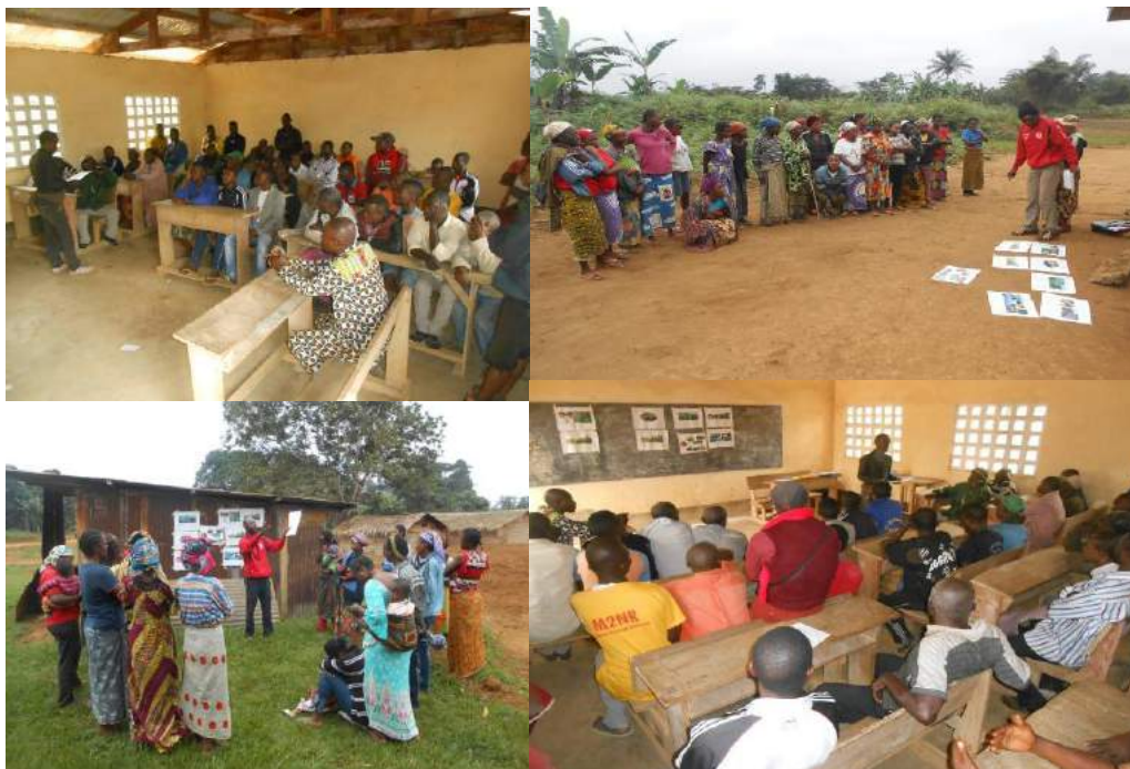
Photo 2: Consultation des communautés locales et populations autochtones dans le département de la Cuvette