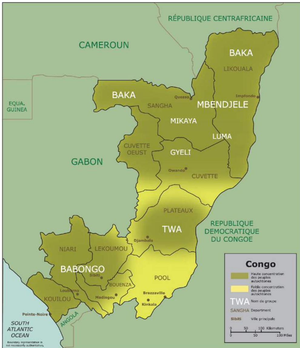
Carte 2: Répartition des grands groupes de populations autochtones