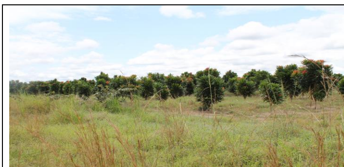
Parcelle d'Azobé ( Lophira elata ) mis en place en 2015 (2 ans) à Oyo

L'Accroissement des stocks de carbone passe par la mise en place des puits de carbone à travers la plantation des arbres. C'est l'un des résultats attendus au titre de la journée nationale de l'arbre, qui s'organise chaque 6 Novembre 2016, sur l'ensemble du territoire national conformément à la loi n°20/96 du 15 Avril 1996, modifiant la loi n°062/84 du 11 Septembre 1984 portant organisation de la Journée Nationale de l'Arbre en République du Congo.