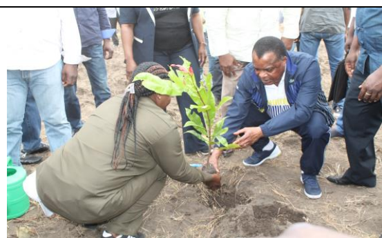
Son Excellence, Denis SASSOU NGUESSO le 6 Novembre 2017 sur le site officiel d'Ebami (Obouya)

La Journée Nationale de l'Arbre, se présente aujourd'hui comme un véritable atout pour opérationnaliser le processus REDD+ en République du Congo.